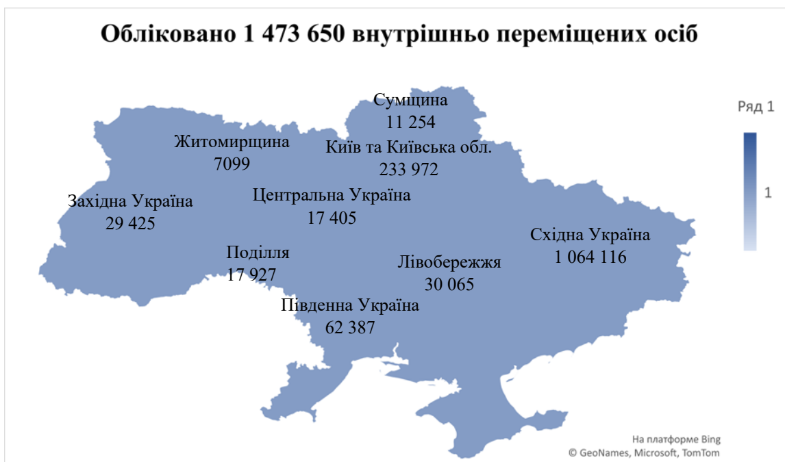
Рис. 2. Карта внутрішнього переміщення на території України за територіальним походженням